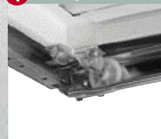
4 Parkering til kørerullerne

Porten standser sikkert i skinnefordybningen.